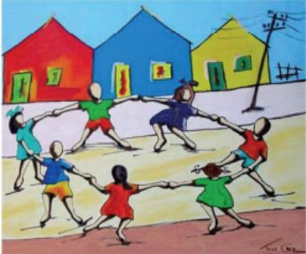
Ciranda II, 2018. Ivan Cruz.