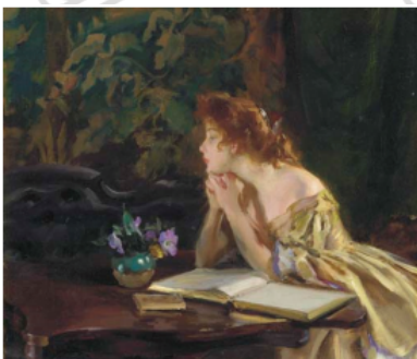
Momentos de ócio , 1901. Irving Ramsey Wiles.