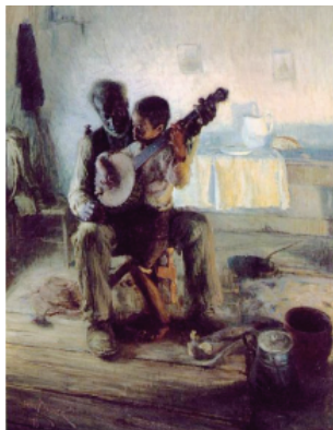
The Banjo Lesson, 1893. Henry Ossawa Tanner.